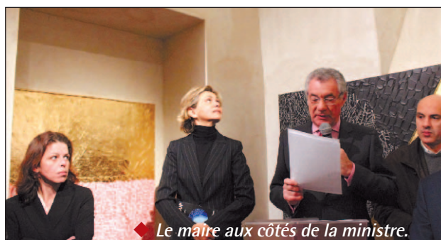
◆ Le maire aux côtés de la ministre.

confie ses toiles d'or», a souligné le maire. Ainsi ses vitraux marquent de son empreinte artistique le prieuré. «Eve, l'arbre verdure et le sablier changent en fonction des rayons du soleil, suivant l'emplacement du spectateur. En ce sens, les vitraux sont à tout le monde», a expliqué Rachel Grataloup à Valérie Pécresse ravie de ce lieu qui invite à