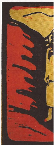
La traversée de la Mer Rouge